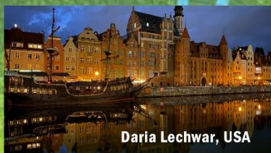
Daria Lechwar, USA