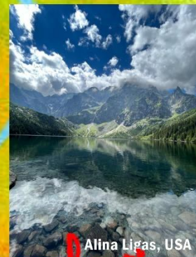
Alina Ligas, USA