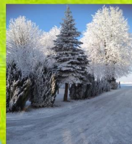
Blanka Pustuła, Hiszpania