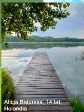
Alieja Bałtorska, 14 lat, Holandia