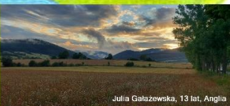
Julia Gałęzewska, 13 lat, Anglia