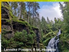
Lenneke Poepjes, 8 lat, Holandia